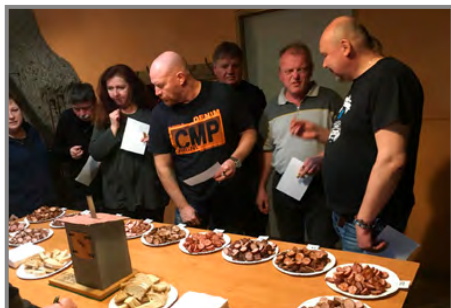
Všechny dodané vzorky jsou podrobeny nekompromisní degustaci