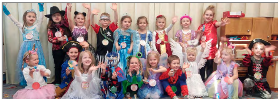
Karneval ve školce se vydařil k radosti dětí

Děti vystoupily s pásmem lidových písní pro místní seniory , které se konalo v prostorách nově zrekonstruovaného zámku.