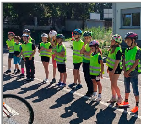
Na dopravním hřišti v Kroměříži

Cyklistický průkaz téměř všichni získali 17. června. Žáci museli zvládnout test z pravidel a pak zkoušku zručnosti na DDH v Kroměříži. Některým „to uteklo“ jenom o bod, ale ve škole jsme pravidla zopakovali a průkaz tedy nakonec získali všichni. Přejeme všem žákům bezpečnou jízdu a šťastný návrat z prázdninových nejen cyklovýletů.