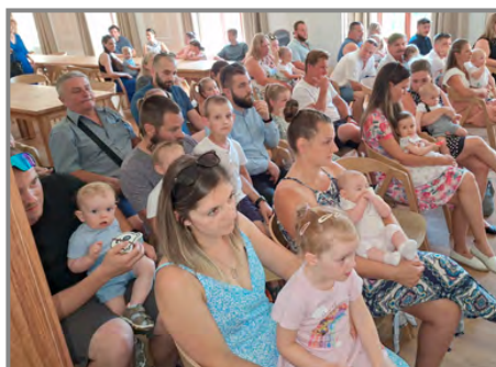
Na zámku se sešlo devět nových občánek spolu s rodiči a příbuznými