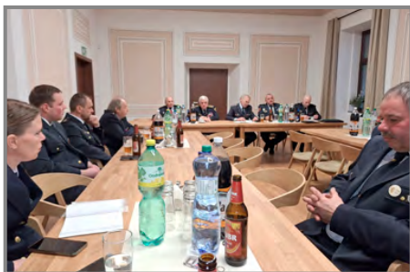
Jednání okrsku SDH se konalo letos v přílepském zámku