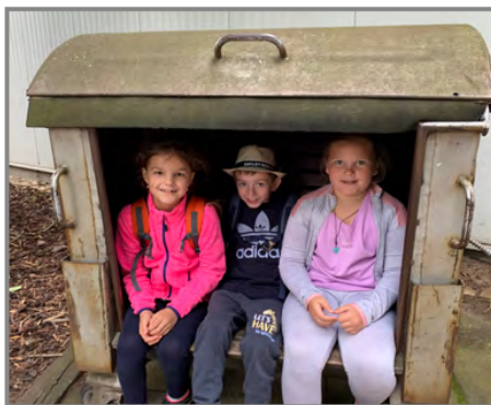
V KovoZOO jsme se naučili něco o racyklaci