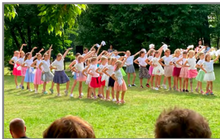
Na pártě v parku jsme se rozloučili se školním rokem

je větší akce naší školy a mateřské školy. Akce probíhala v přílepském zámeckém parku za přítomnosti rodin a kamarádů našich žáků, všech zaměstnanců školy i školky a také zastupitelů Obce Přílepy. Loučili jsme se se školním rokem, bilancovali, loučili se s pátáky, kteří odcházejí a vítali budoucí žáky. Žáci mateřské školy se nám předvedli s tanečním programem. Klauni a předškoláci byli pasováni na školáky. Žáci školy si zatančili na písničky z muzikálu Pomáda. Vyhodnotili jsme úspěchy žáků, odměnili nejlepší sběrače a na závěr si dali zmrzlinu a opekli špekáčky. Letos odchází na 2. stupeň 13 žáků. Jeden žák byl přijat ke studiu na osmiletém gymnáziu, 2 žáci byli přijati do třídy s rozšířenou výukou matematiky, 5 žáků nastoupí do třídy s rozšířenou výukou tělesné výchovy a ostatní se zařadí do běžné 6. třídy. Všem přejeeme, aby se jim v nové škole dařilo, našli si nové kamarády a získali nové dovednosti