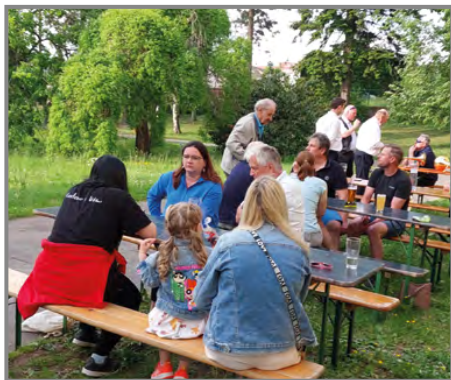
Pouťová sousedská beseda se konala v zámeckém parku