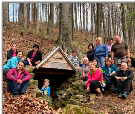
Obřadní otevření Stříbrné studánky

Zastavení u Stříbrné studánky: Jedno z nejpamátnějších zastavení bylo u Stříbrné studánky, kde jsme si dopřáli odpočinek a občerstvení. Vůně opečených špekáčků se linula vzduchem a dodávala celé akci přátelskou a rodinnou atmosféru. U ohně jsme sdíleli příběhy, smáli se a těšili se z přítomnosti jeden druhého.