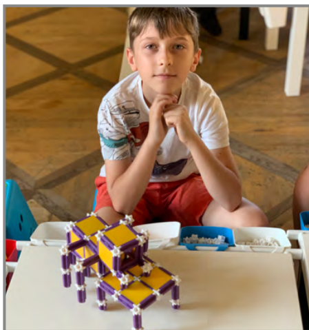
Největším zážitkem bylo sestavování vlastních modelů