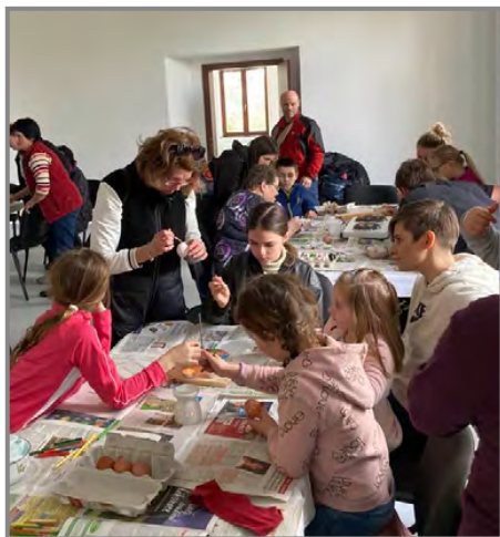
Na velikonočním tvoření se vyráběly kraslice