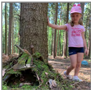
K oblíbené činnosti v lese patří stavění domečků

Zatímco se vybraní žáci věnovali sportu na atletickém trojboji ve Fryštáku, ostatní nelenili a vydali se na vycházku do lesa. Trasou kolem kapličky, kde si poslechli pověst O bílých pannách, žáci pokračovali dále do lesa. V průběhu vycházky soutěžili například v hodu šiškou nebo přecházení klády. V lese je čekala svačinka. Potom co načerpaly dost sil, postavili s kamarády domečky pro skřítky. Skřítky jsme nezahlídlí, ale domečky se líbily hmyzu, který se v nich brzy zabydlel. Každá skupinka svůj dům pojmenovala a prezentovala ho ostatním. Po návratu byly body získané v soutěžích sečteny a žáci, kterým se tentokrát nejlépe dařilo, získali malou odměnu. Nejhezčí odměna je však společně strávený čas v přírodě. A ten si užili úplně všichni.