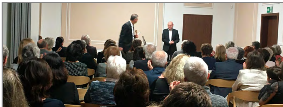
Na benefičním koncertě zazněla díla českých mistrů