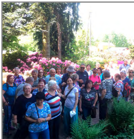
Přílepkští zahrádkáři obdivovali okrasné zahrady v Polsku

Teď už jen provádíme běžné provozní věci jako sečení trávy, úklid po bazárku a čekáme, jaká bude úroda ovoce, aby naše provozovna sloužila i zahrádkářským potřebám.