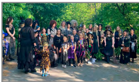
Čarodějnice se tradičně slétly pod lesem nad skalou