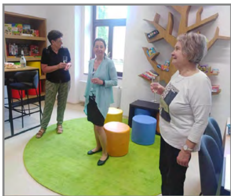
Slavnostní přípitek k otevření nové knihovny