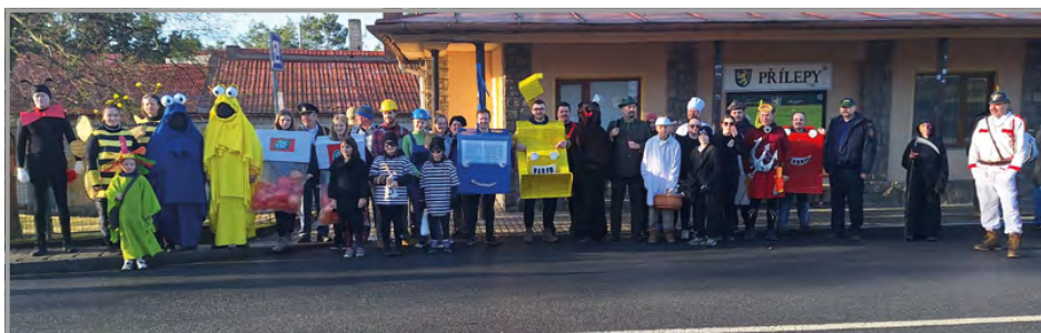
Masopustní průvod před odchodem do ulic