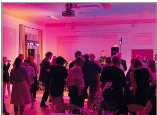
1. Zámecký ples