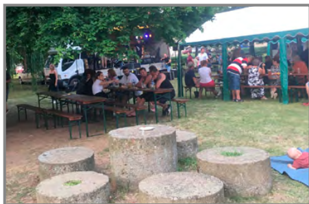
Přílepský čtyřlístek se konal v rámci přílepské pouti na návsi. V popředí tzv. "přílepské kameny"