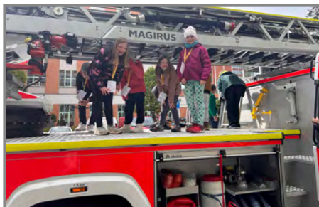
Děti si s nadšením prohlédly záchranářskou techniku

jak doma předejít požáru nebo jak správně uhasit hořící hrnec. Zdravotničtí záchranáři nás provedli základy první pomoci a mohli jsme vyzkoušet i masáž srdce na figuríně. Tato akce se dětem moc líbila a i organizačně byla velice dobře zvládnuta.