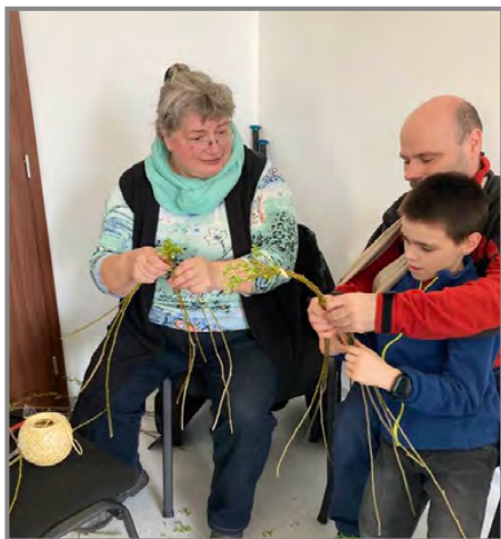
A taky se pletly velikonoční pomlázky, u nás tatarů