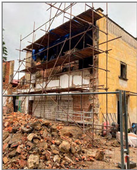
Horní křídlo bude z důvodu narušené statiky znova vystavěno