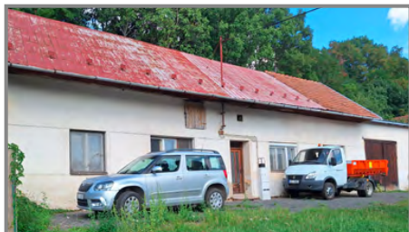
Dočasné prostory technického zázemí obce - dům Válkových.

Další část materiálu jako je pódium, taneční, parket lavice, prostředky pro pořádání soutěží v požárním útoku a další materiál SDH byly přestěhovány částečně do zámecké spížirny u vstupu do parku a čas-