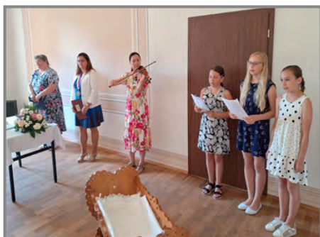
Po úvodním slovu následovalo krátké pásmo básniček a písniček