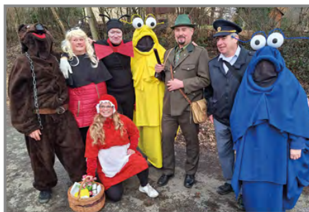
Medvěda tradičně doprovázelo mnoho nápaditých masek