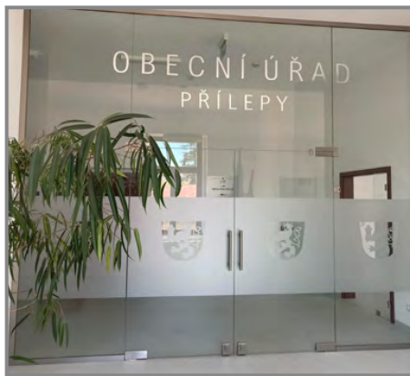
Vstup na obecní úřad ve 2NP zámku

Budova obecního úřadu bude zatím pronajímána na kancelářské prostory, než se přesune MŠ do nových prostor a budova se po získání dotací nezačne také rekonstruovat na hasičskou stanici a technické zázemí obce.