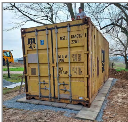
K uložení materiálu posloužil také nově pořízený lodní kontejner