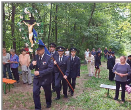
Procesní kříž z roku 1835 nechybí na Floriánské mši ani dnes