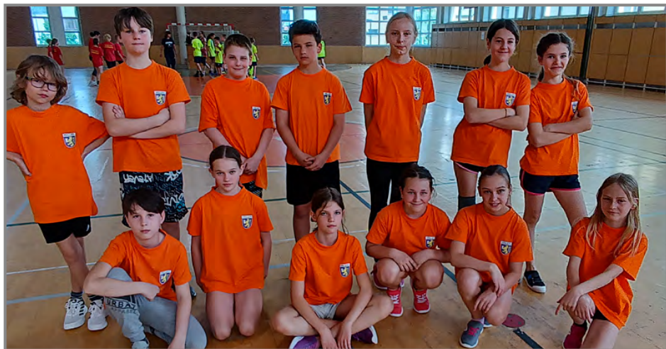
Naše družstvo – turnaj ve vybíjené

školy družstva z 1. ZŠ Holešov, ZŠ Ludslavice, ZŠ Prusinovice a ZŠ Žeranovice. Naše družstvo tvořené dívkami a chlapci pátého ročníku získalo 4. místo. Gratulujeme.