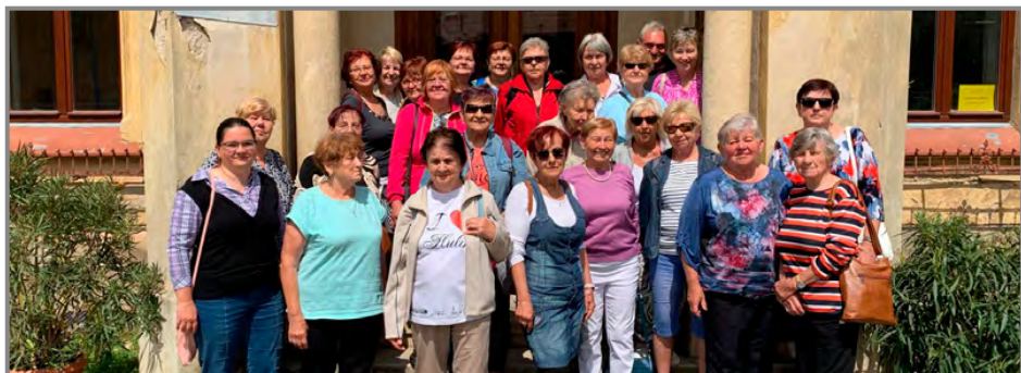
Hulínské seniory provedla zámek starostka obce