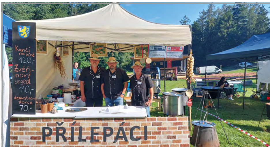
Tým Přílepků obhájil zlato na Gulášových slavnostech ve Frenštátě