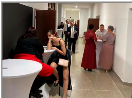
Ples naplnil celé INP zámku

SDH PŘÍLEPY ZVE VŠECHNY DĚTI, RODIČE A PRARODIČE