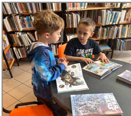
V holešovské knihovně