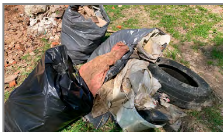
Naplnění pytlů rozházeným odpadem je bohužel vždy jistotou

V letošním roce vycházel celorepublikový úklidový den Uklidme Česko na první sobotu v dubnu, kdy se pravidelně koná akce Otvírání studánek. Posunuli jsme tedy úklid o jeden týden později. Počasí přálo a dobrovolné úklidové čety se rozešly podél potoků a cyklostezky. I přesto, že je v obci umístěno spousta odpadkových košů, přesto se najde dost