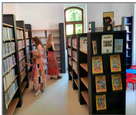
Nové oddělení pro dospělé čtenáře