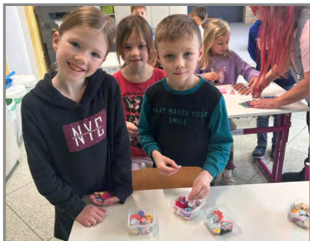
Děti tvořily pránička a krabičky na sladkosti

Děti měly za úkol vytvořit si práničko a krabičku ozdobenou barevnými kamínky. Všichni se moc snažili a vyrábění jim šlo krásně od ruky. Do hotové krabičky pak umístili ještě malou sladkost a jednu dostali samozřejmě i pro sebe.