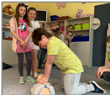
Žáci si vyzkoušeli i masáž srdce na figuríně