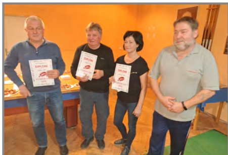
Vyhlášení nejlepších klobásek pro rok 2024