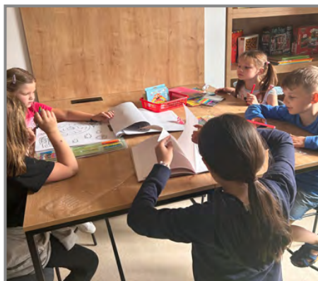
Děti vyzkoušely herní kout nové přílepské knihovny