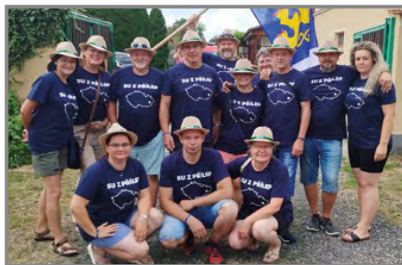
„Su z Přílep“ naše reprezentace na Přílepském čtyřlístku