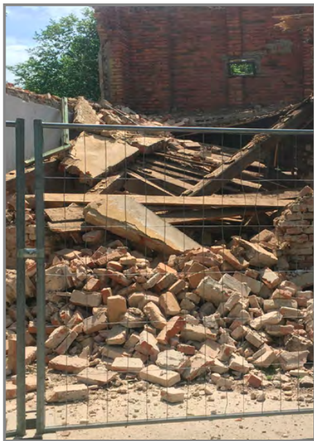
Každá rekonstrukce začíná bouracími pracemi