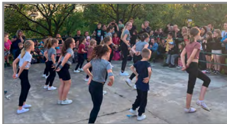
Vystoupení dětí z „míčovek“ přílepského Sokola

program, stejně tak desítky čarodějnic různého věku i spokojených návštěvníků, které pobavily nejen sokolské děti krátkou pohádkou, ale zejména nahlédnutí do tajemného světa japonských gejš.