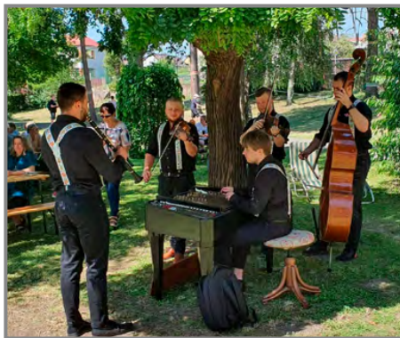
Odpoledne zpestřilo vystoupení cimbálové muziky Kalíšek