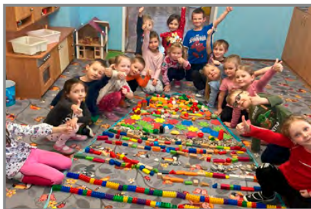
Nejradši si hrajeme všichni pospolu