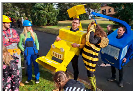
Parta Bořka stavitele přijela na pomoc při rekonstrukcích v Přílepech