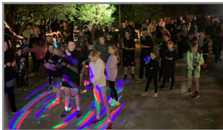
Parquet obsadila JustDance párty