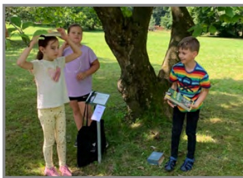
Den dětí jsme oslavili hřítkami v parku

Nejlepší družstvo bylo odměněno věcnými cenami, ale všichni si zasloužili v tento parný den za své výkony studené ochlazení dobrou zmrzlinou!