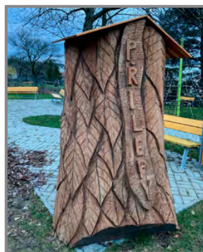
Další vyřezávaná knihobudka je na hřišti za pánicí