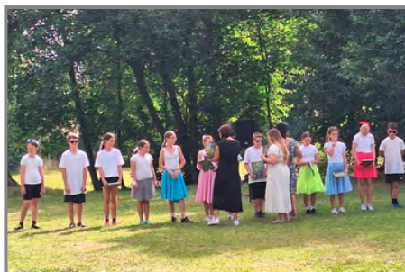
Rozloučení s pátáky bylo milé a velmi emotivní

Celý školní rok na naší škole probíhá sběr kaštanů, starého papíru a pomerančové kůry. Zde jsou nejlepší sběrači: