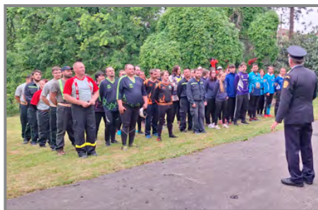
Nástup družstev na okrskové soutěži v Přílepech