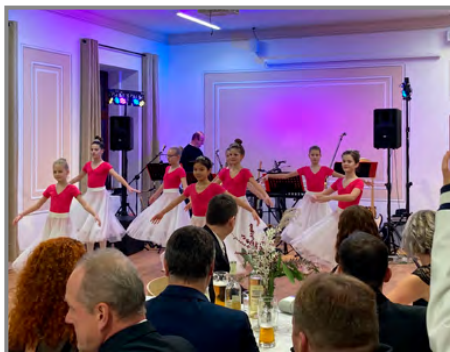
Ples zahájily přílepské baletky ze ZUŠ Holešov skladbou Valz květin