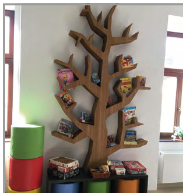
Interiér nové zámecké knihovny