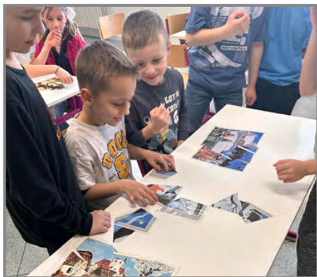
Na závěr čekal děti vědomostní kvíz o Josefu Ladovi

Paní Lišková také donesla spoustu knížek plných jeho typických ilustrací, které si děti se zájmem prohlížely. Na závěr besedy měla pro děti připraven vědomostní kvíz a sladkou odměnu.