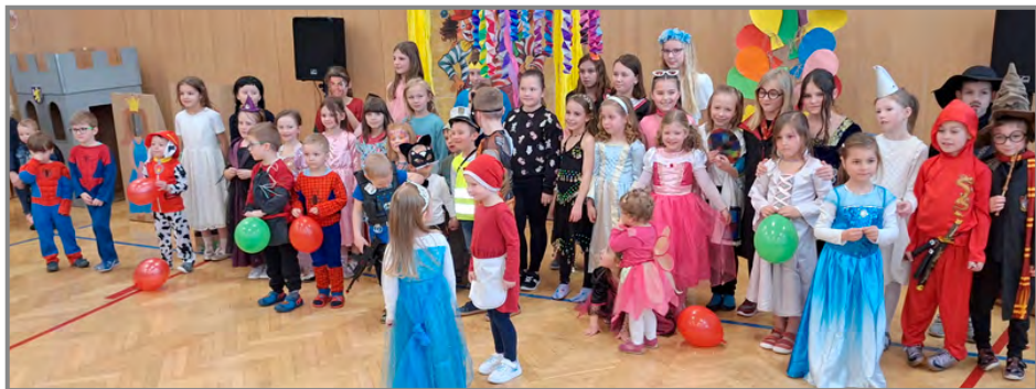
Ani letos nechyběla společná fotka všech masek