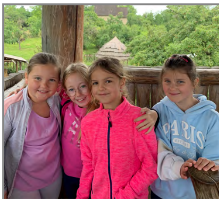
Jedním z cílů školního výletu byl archeoskanzen Modrá