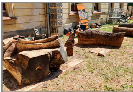
Letos se řezbovaly především lavičky do zámeckého parku

Připraveno bylo po celý den také mnoho aktivit pro děti, které tak mohly skotačit na skákacím hradu, projet se na koních, projít si lanovou stezku mezi stromy, prohlédnout a vyzkoušet si hasičskou techniku nebo si nechat namalovat obličej.