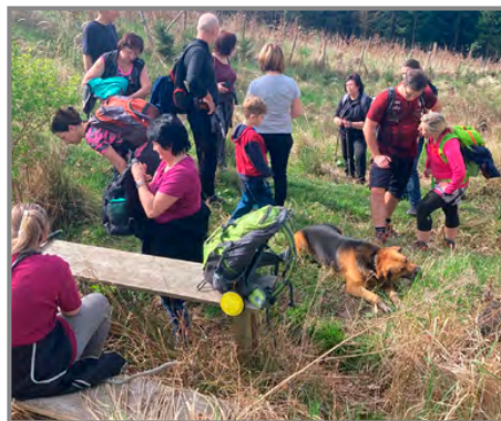
Odpočinek na cestě ke studánkám