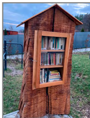
Knížky si můžete vypůjčit, ponechat, vyměnit nebo vložít ty, co již doma nepotřebujete