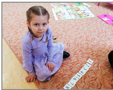
Od září nastoupí do 1. třídy 8 chlapců a 7 děvčat

Proběhl v pátek 19. dubna. K zápisu se dostavilo 15 dětí a všichni byli přijati k povinné školní docházce. Odklad povinné školní docházky v letošním roce udělen nebyl. Od září bude navštěvovat naši školu 8 chlapců a 7 děvčat.