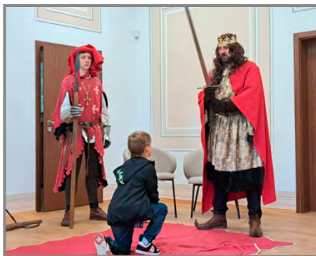
Pasování proběhlo letos v přílepském zámku

Jako každý rok se během června vydala celá škola na školní výlet. Tentokrát žáci navštívili Archeoskanzen Modrá. Ve skanzenu si žáci prohlédli, jak lidé žili v období Velké Moravy. Měli možnost nahlédnout do obydlí řemeslníků, ale i do školy či do „paláce“. Nechyběla ani zastávka u stánku se suvenýry. Dále jsme se krátkou procházkou přemístili do Velehradu, abychom nahlédli do Baziliky Nanebevzetí Panny Marie a svatého Cyrila a Metoděje. Výlet jsme završili návštěvou KovoZoo ve Starém Městě. Kromě zvlírat z recyklovaného kovu byla k vidění i výstava veteránů. Žáci se svezli speciálním vláčkem jménem „Steelinka“, který děti zavezl do areálu, kde se kov třídí a následně recykluje. Měli jsme tedy možnost si prohlédnout recyklaci zblízka a poslechnout si poutavý výklad pana řidiče.