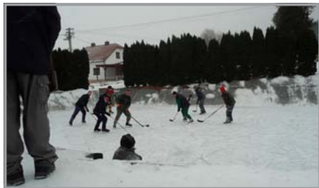
Hokej to byl divácky atraktivní

Jednoho únorového nedělního odpoledne tomu však bylo jinak. Pečlivě uklizená ledová plocha se zaplnila opět po mnoha letech plně „hokejisty“. Na vzpomínkové akci se zde totiž sešli starší páni, kteří zde pravidelně štoukali hokejkou do puku před dvaceti, třiceti