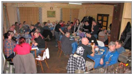
Hospoda U Páralů se zaplnila do posledního místa

U slivovice a ostatních darů přírody čas rychle ubíhal a při zpěvu a muzice harmonikářské kapely vydržel jen málokdo