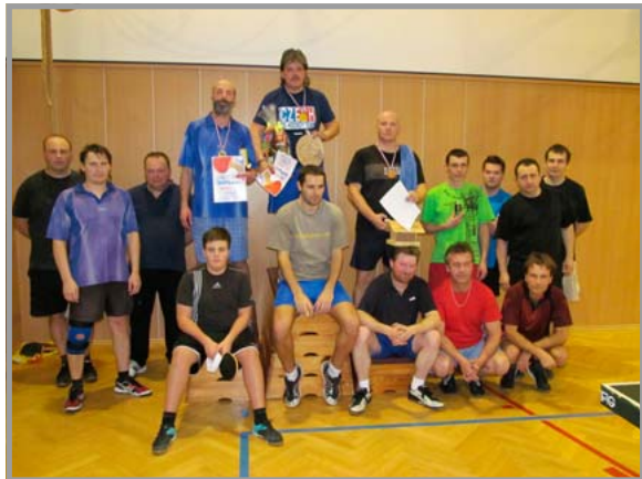
Společné foto účastníků turnaje

Vánoční turnaj ve stolním tenisu má v Přílepiích mnohaletou tradici. Za dob fungování TJ Sokola se v osmdesátých letech konával v sále dnešní restaurace U Miloše a účast bývala vždy hojná. Před deseti lety byl tento turnaj znova obnoven a jeho dění přesunuto do sportovnějších prostor – do tělocvičny základní školy. V posledních letech má turnaj stále vyšší úroveň a pravidelně se jej účastní nejen pořádající hráči z Přílepy, ale také oddíloví hráči z Holešova a Fryštáku. Ani v posledním turnaji 29. prosince 2013 tomu nebylo jinak a domácí nejlepší hráč se tak umístil až na třetím místě, když zlato a stříbro získali přespolní.