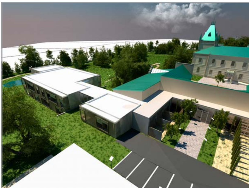
Architektonický návrh přístavby pavilónu k hospodářské budově