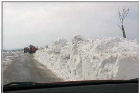
Silnice do Holešova den po velikonočním pondělí

strukce silnice Fryšták-Horní Lapač. V dopise nám bylo dále sděleno, že v průběhu uza- vírky této silnice bude vedena objížďka pro nákladní dopravu přes Míškovice a omezení