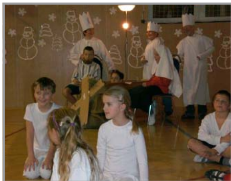
Jeden z koutů tělocvičny představující zimu a zimní zvyky

Čas vánoční se naplnil a my jsme vykročili s chutí a elánem plni očekávání do nového roku 2013.