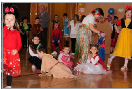
Děti se bavily soutěžením, tancem i dle libosti

Tato akce patří již k tradicím naší školy, kterou pro děti připravují rodiče Klubu rodičů a další dobrovolníci. Na tuto akci se děti velmi těší, a tak nebyl problém zaplnit v sobotu 16. února celou tělocvičnu. Díky štědrosti sponzorů se tak mohly všechny pohádkové bytosti veselit, tančit a soutěžit až do večera. Drobných odměn se dočkaly i maminky a babičky – za své bábovky a koláče přinesené do soutěže. Všem ochotným dobrovolníkům pod vedením paní Ireny Tvrdoňové moc děkujeme. Rozzářené oči dětí toho byly jistě důkazem.