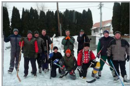
Staří páni hokejisté na přílepském rybníku

Nedokážu napsat kdo vyhrál, nebo kdo byl lepší, ale fakt, že chlapi po tolika letech obuli brusle a to co se odehrávalo na ledě se skutečně podobalo hokeji je samo o sobě vítězstvím všech zúčastněných. Všech, kteří se v mrazivém odpoledni sešli na rybníku a na místo domácí pohody či posezení ve vytopené hospůdce si s chutí zahráli tuto národní českou hru. Vždyť při pohledu na jedinou zamrzlou láhev piva bylo jasné, že zde o nic jiného než o sport a aktivní zábavu nejde.