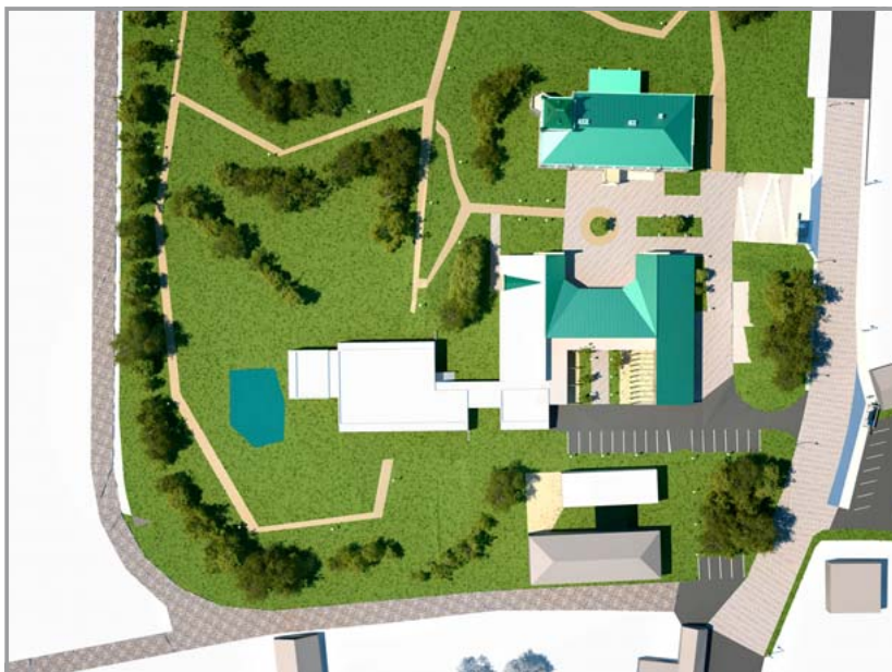
Takto by měl dle architektonické studie celý areál vypadat z ptačí perspektivy