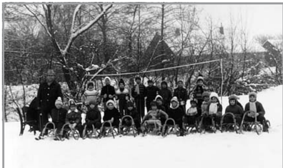
Sáňkařské závody na louce u mlýna v roce 1978