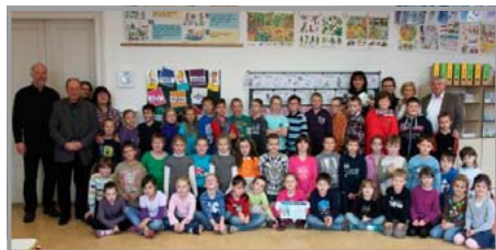
Žáci a učitelky ZŠ Přílepy s návštěvou z poslanecké sněmovny

Soutěž se konala od 6. do 24. prosince 2012 a díky poutavé grafice rozvíjela počítačovou gramotnost a povědomí žáků o tísňovém čísle 112. Zúčastnilo se jí 11 škol ze Zlínského kraje. Naše škola získala s 14 731 body 1. místo a finanční odměnu 10 000,- Kč. O jejím využití necháme rozhodnout samotné žáky. Všem, kteří nás podpořili a místo předvánočního úklidu a nákupů bojovali za naši školu, děkujeme.