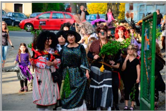
Příchod čarodějnic na rejdiště

opéct první letošní špekáčky. Na parketu se mezi tím konala diskotéka pro nejmenší čarodějnice, plná dětských hitů a barevných světel a ti všímavější mohli dle příprav tušit, o čem bude letošní čarodějnické vystoupení.