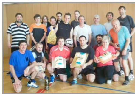
Účastníci přílepské nohejbalové ligy – v popředí zástupci nejlepších družstev s cenami

Nohejbalový oddíl Sokola Přílepy uspořádal II. ročník Přílepské nohejbalové ligy pro rok