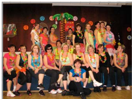
Se zumbou na Hawaii