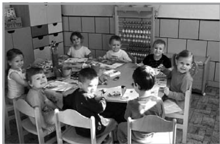
Malování sluníček děti bavilo

svítí a hřeje. Dny jsme zakončili malováním obrázků s touto tematikou, které nyní zdobí naši mateřskou školu. Veselé úsměvy na tvá-