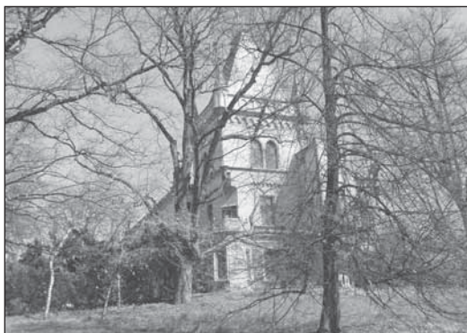
Po odstranění náletů a křovin se otevřel pohled na zámek z jižní strany

V současnosti probíhá v parku nejkrásnější období, kdy zde všechno kvete a voní. Přijďte se sami přesvědčit, za vycházku toto místo jistě stojí.