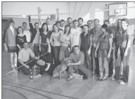
Účastníci mezinárodního turnaje v Přílepech

Je to tak. Ve světě volejbalu se pořád něco děje. Takže: Volejbalu ZDAR!!!!!!