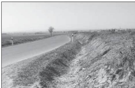
Upravená krajnice na úseku Přílepy - Holešov

Úsek silnice III. třídy Přílepy - Holešov se stal v posledních letech místem mnoha více či méně vážných dopravních nehod. Vzhledem k této situaci a v zájmu zlepšit bezpečnost a plynulost provozu se přes opakovaná jednání s Ředitelstvím silnic Zlínského kraje podařilo dohodnout úpravy tohoto úseku. V začátku roku bylo započato s pracemi a byly pročištěny příkopy po obou stranách v celé délce a částečně zpevněna krajnice. Současně s úpravou krajnic byly vykáceny suché a ve výhledu bránící stromy podél silnice. V závěru prací byly osazeny v obou směrech krajové sloupky (patníky). Věříme, že tyto se nestanou terčem vandalů a budou sloužit dlouho svému účelu.