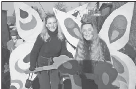
Ozdoba průvodu - rozjásání barevní motýlci