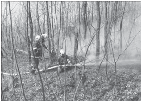
Zásah hasičů na hořící les - požár se daří dostat pod kontrolu

Dodatek: Velitel SDH Přílepy by tímto chtěl poděkovat všem dobrovolníkům a zúčastněným členům své jednotky, kteří se na hašení obětavě podíleli.