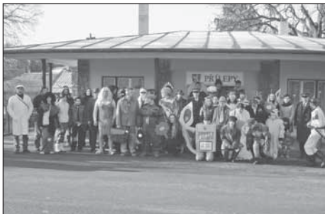
Maškarní průvod před novou klubovnou SDH

Porađatelem a udržovatelem tradice „Vodění medvěda“ je po mnoho let Sbor dobrovolných hasičů Přílepy.