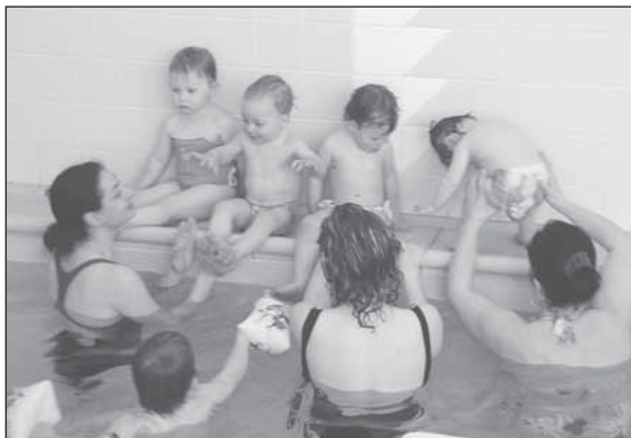
Vody se už nebojíme ! Spokojené dětičky s maminkami v bazénu přílepské ZŠ

Přestože porodnice už v Přílepech není celou řádku let, na nedostatek nových občánků si naříkat nemusíme. Především v posledních letech Přílepy ožívají dětským smíchem, což by nám leckterá jiná obec v okolí mohla závidět. A kde je hodně dětí, tam jsou i maminky na mateřské dovolené. Právě jim se rozhodlo vyjít vstříc vedení školy a nabídlo jim možnost využívat krytý plavecký bazén.