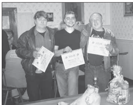
Dekorovaní vítězové Koštu přílepské slivovice

Košť slivovice je tradičně doprovázen koštěm kyselého zelí, které nesporně patří mezi další venkovské pochutiny. Hodnocení probíhá stejně jako u slivovice, ale komisí se stávají všichni přítomní.